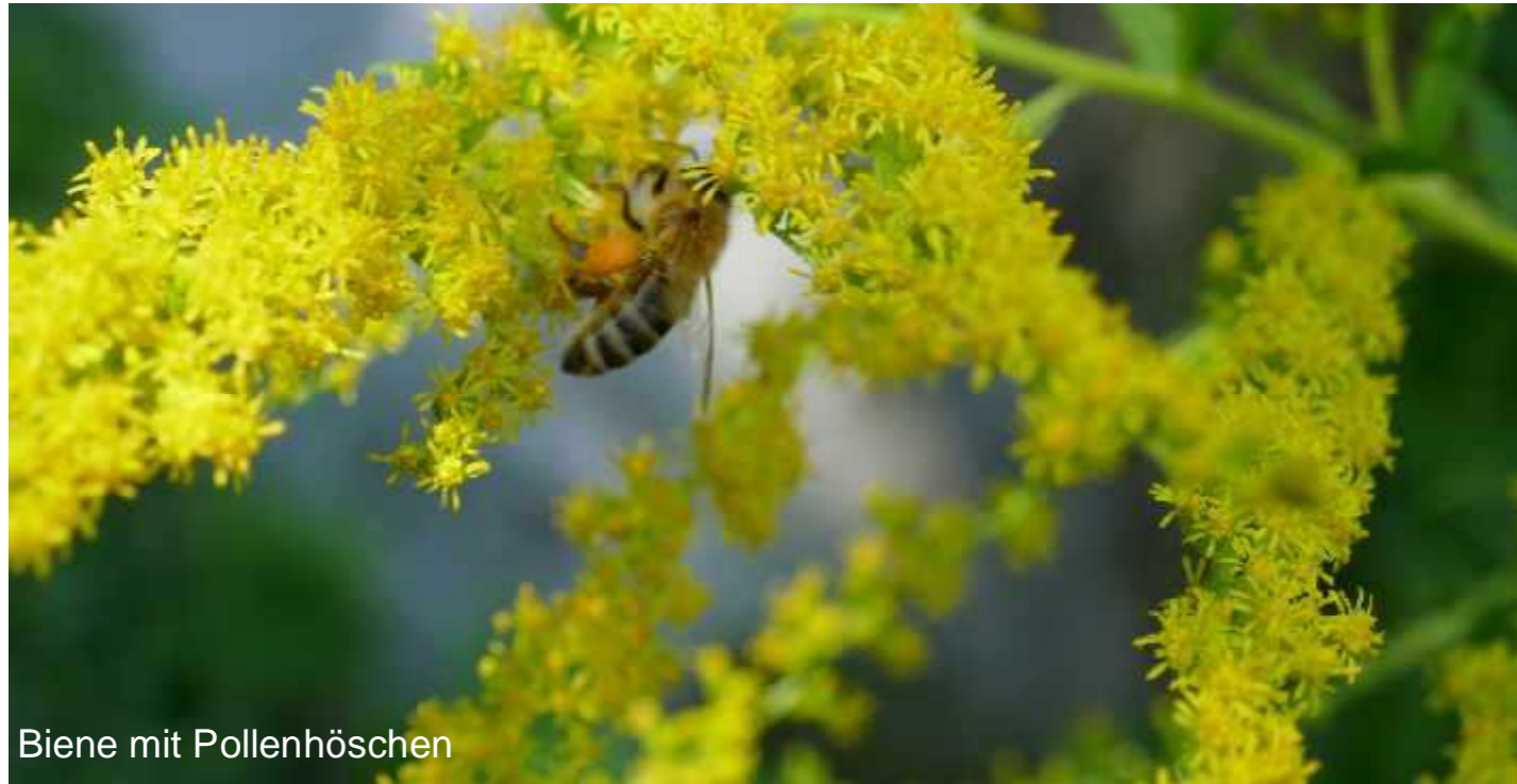
Biene mit Pollenhöschen

Honig gehört für viele Menschen zum Frühstück dazu. Ist das Glas einmal leer, werfen wir es (meistens) einfach weg. Dieses Honigglas mit kleinsten Resten zieht allerdings die Bienen auf ihrer Nahrungssuche an, denn sie sammeln nicht nur Pollen.