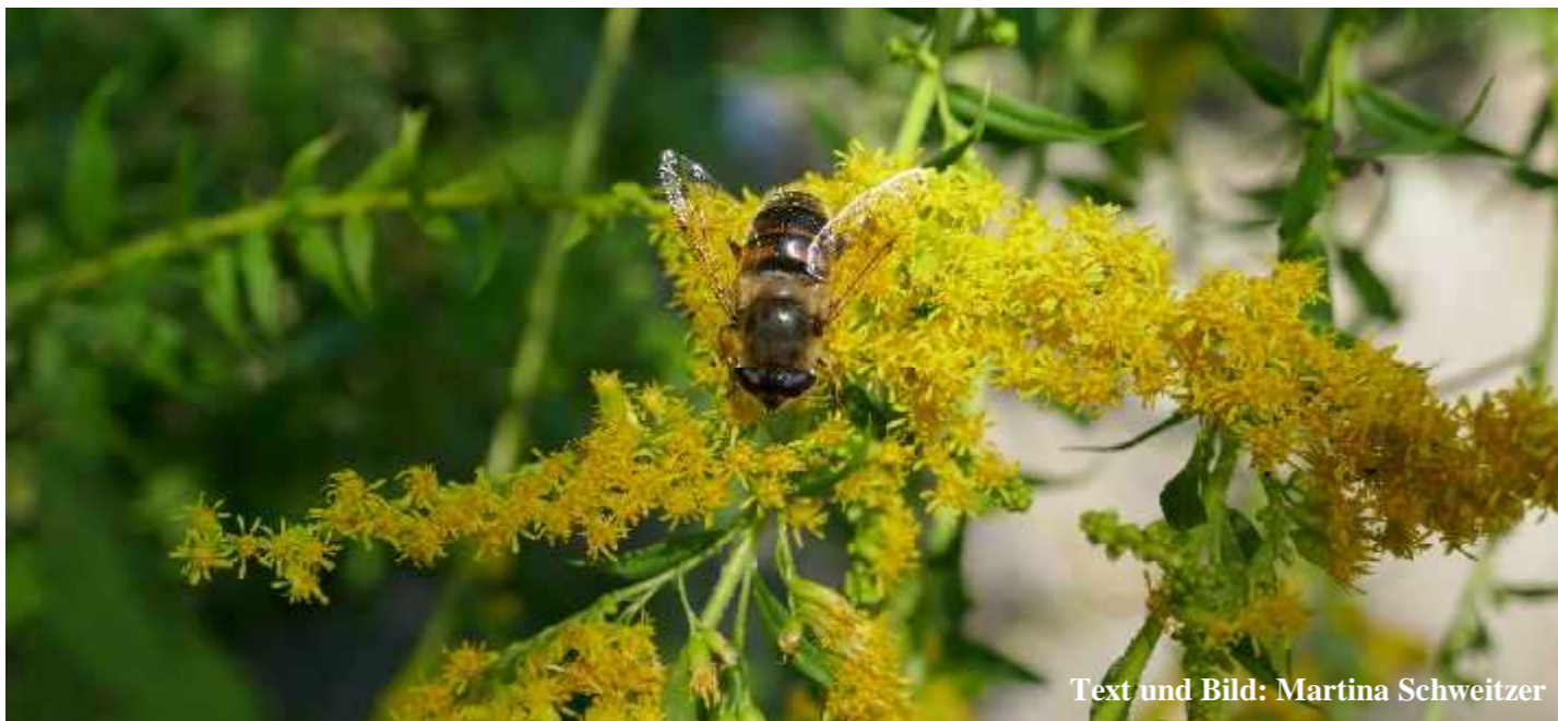
Text und Bild: Martina Schweitzer

Die amerikanische Faulbrut ist, trotz ihres Namens, weltweit verbreitet. Die Sporen sind sehr widerstandsfähig, selbst bis zu 120 Grad Celsius. Imker raten daher, die Honiggläser gründlich auszuspülen, bevor wir sie entsorgen.